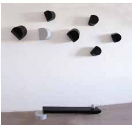
Tra terra e cielo, 2019