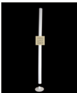
Fragili equilibri, 2019 Tubo di cartone, legno, cm 300 h x15x30